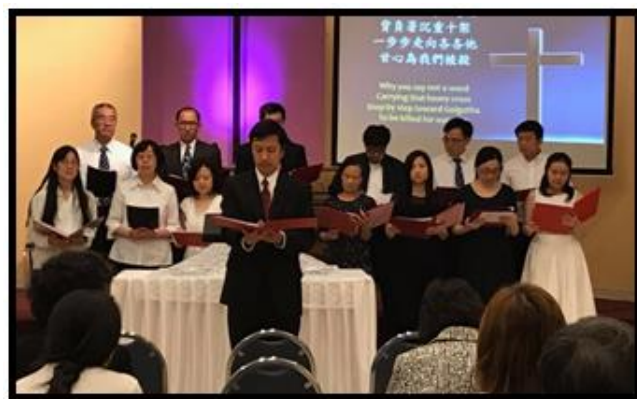
教會詩班獻詩：加略山的愛