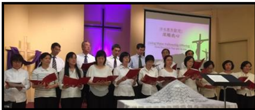
活水團契獻詩：觸動我心