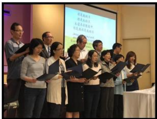
UNO 團契獻詩：愛我願意