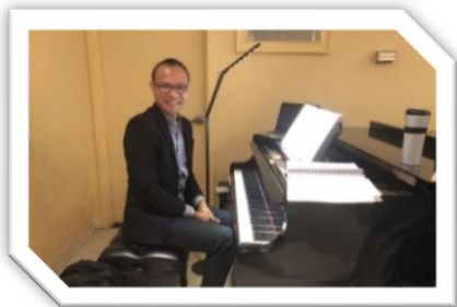
鋼琴伴奏：李建一弟兄