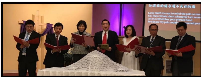
執事獻詩：祢釘痕的手