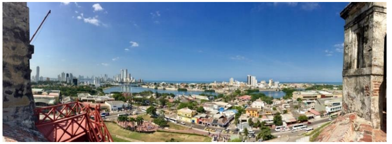
Old City New City, Cartagena de Indias

Cartagena de Indias, Columbia January 26, 2017