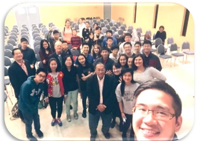
← 英文團契 ↑

February Begin volunteer and student sign up for VBS (May 29- June 2017)