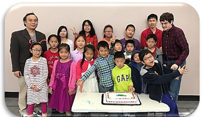
主日學老師與可愛的學生 ↓