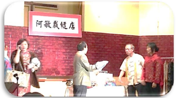
↑ 活水團契 ↓