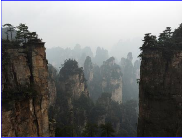
Zhangjiajie (張家界), Hunan, China

I n the beginning God created the heaven and the earth. - 創世記 Genesis 1:1